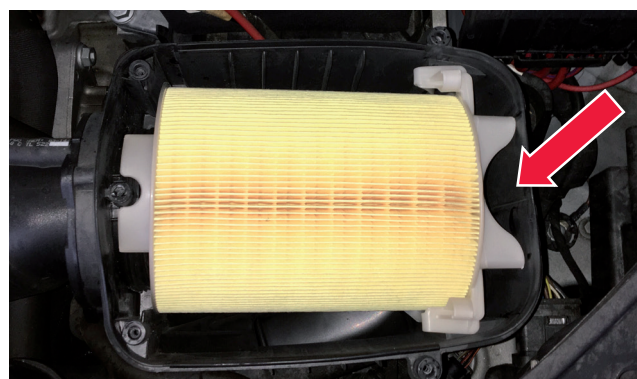
Zdjęcie 3: Drugi etap montażu – ząbienie wspomnianych dodatkowych zaczepów mocujących w obudowie

WAŻNE! Jeśli dany wkład filtra różni się wizualnie i konstrukcyjnie od podobnych wkładów, nie stanowi to wady. Wręcz przeciwnie, taka konstrukcja zapewnia optymalne zamocowanie w obudowie filtra.