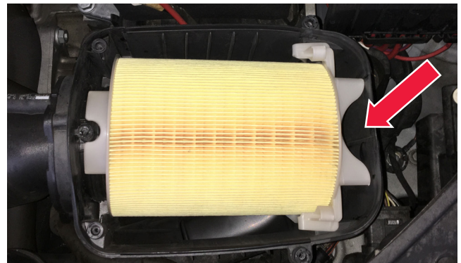
Abbildung 3: Schritt zwei der Montage – Fixierhilfen einrasten lassen

WICHTIG! Der optische und konstruktive Unterschied zu vergleichbaren Luftfiltereinsätzen stellt keinen Mangel dar, ganz im Gegenteil, er sorgt für einen optimalen Sitz im Filtergehäuse.