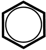
733.100 M 10x140/M 8x121

Schraubenkopf / Head shape Anziehreihenfolge/Tightening sequence/Ordre de serrage/Orden de apriete Tête de vis / Cabeza de tornillo