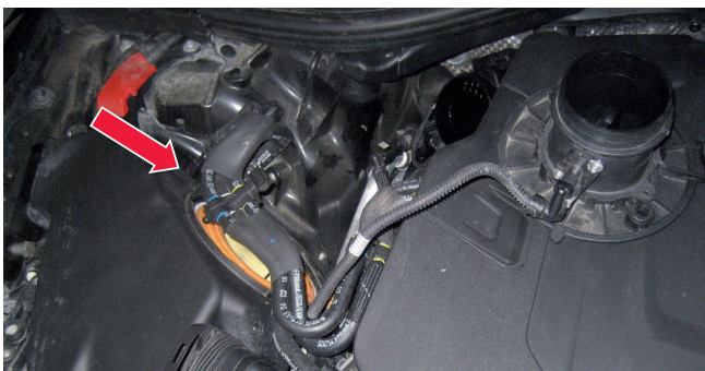
Εικόνα 1: Θέση εγκατάστασης του φίλτρου αέρα σε κινητήρα V6 3.0 TDI

Λόγω της λάθος τοποθέτησης ενδέχεται να προκληθούν, μεταξύ άλλων, και οι ως άνω ζημιές. Αιτία είναι οι στροβιλισμοί και τα μη ευνοϊκά ρεύματα που αλλοιώνουν το σήμα του μετρητή της μάζας αέρα. Επίσης, ακάθαρτος αέρας εισχωρεί στον κινητήρα, με αποτέλεσμα να προκαλείται αυξημένη φθορά ή άλλες επακόλουθες ζημιές.