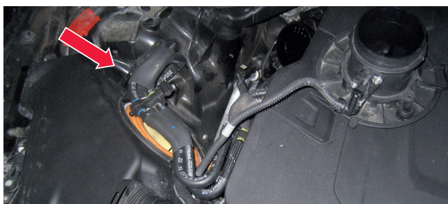
Рисунок 1: Положение воздушного фильтра в двигателе V6 3.0 TDI

В результате неправильного размещения могут возникнуть, в частности, описанные выше неисправности. В фильтре образуются вихревые движения и неблагоприятные потоки воздуха, которые приводят к искажению сигнала расходомера массы воздуха. Кроме того, неочищенный воздух поступает в двигатель, что может привести к повышенному износу и другим повреждениям.