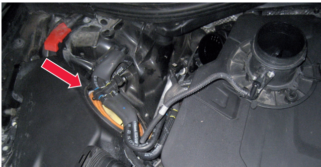
Abbildung 1: Einbaulage des Luftfilters bei einem V6 3.0 TDI Motor

Durch die falsche Positionierung kann es unter anderem zu den oben genannten Störungen kommen. Hintergrund sind Verwirbelungen und ungünstige Strömungen, welche das Signal des Luftmassenmessers verfälschen. Darüber hinaus gelangt ungereinigte Luft in den Motor, was wiederum zu erhöhtem Verschleiß oder sonstigen Folgeschäden führen kann.