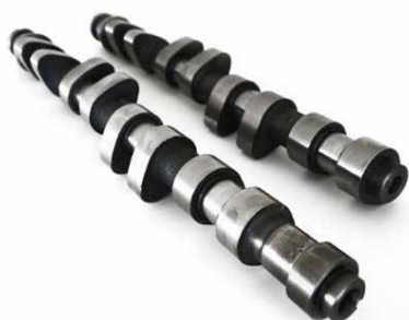
ÁRBOLES DE LEVAS

Usaremos el aceite de montaje Ajulube en todos aquellos casos en los que se realice el montaje de un componente mecánico y móvil del motor . Principalmente, aplicaremos el aceite de montaje Ajulube en los siguientes componentes: