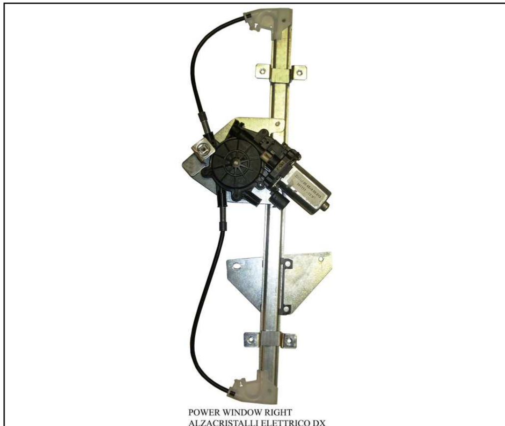
POWER WINDOW RIGHT ALZACRISTALLI ELETTRICO DX

right door - portière droite - rechte tür - puerta lado derecho - porta direita - rechterportier - porta lato destro