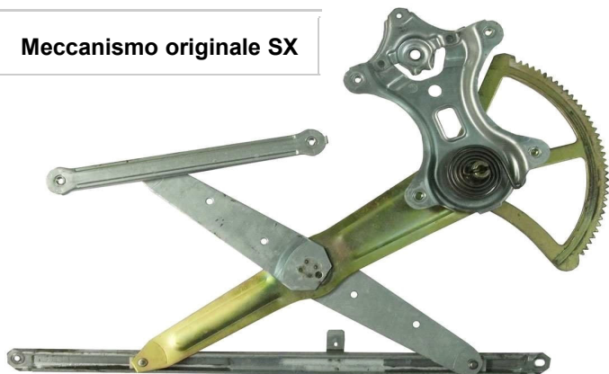
Meccanismo originale SX