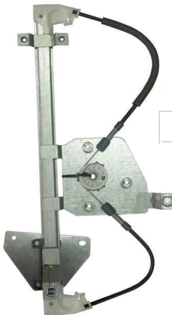
Ns meccanismo SX