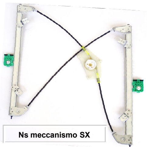
Ns meccanismo SX