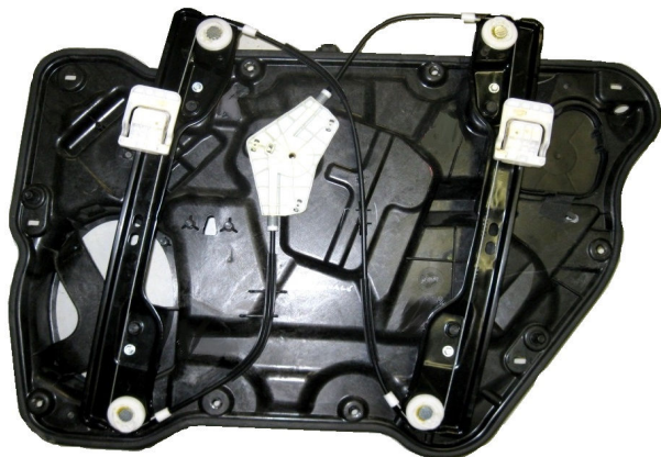
Meccanismo originale SX con pannello

SOLO MECCANISMO (NO PANNELLO) MECHANISM ONLY (NO PANEL) MECANISME (PAS DE PANNEAU)