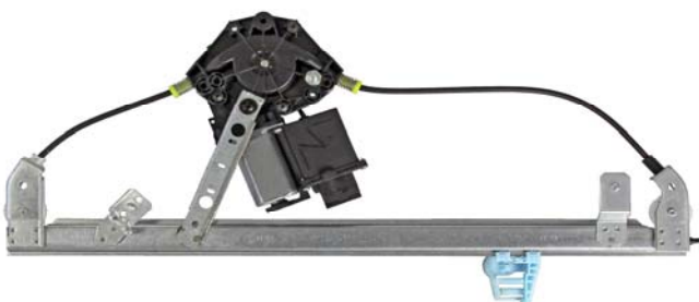
alzacristallo sinistro power window left

Pour la fonction anti-pincement, se recommande de bien nettoyer le vitre autour de la zone de contact avec le joint et vérifier qu'il ne soit pas déformé de manière que le vitre puisse monter sans s'arrêter.