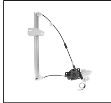
Nuestro elevavinas Our window regulator