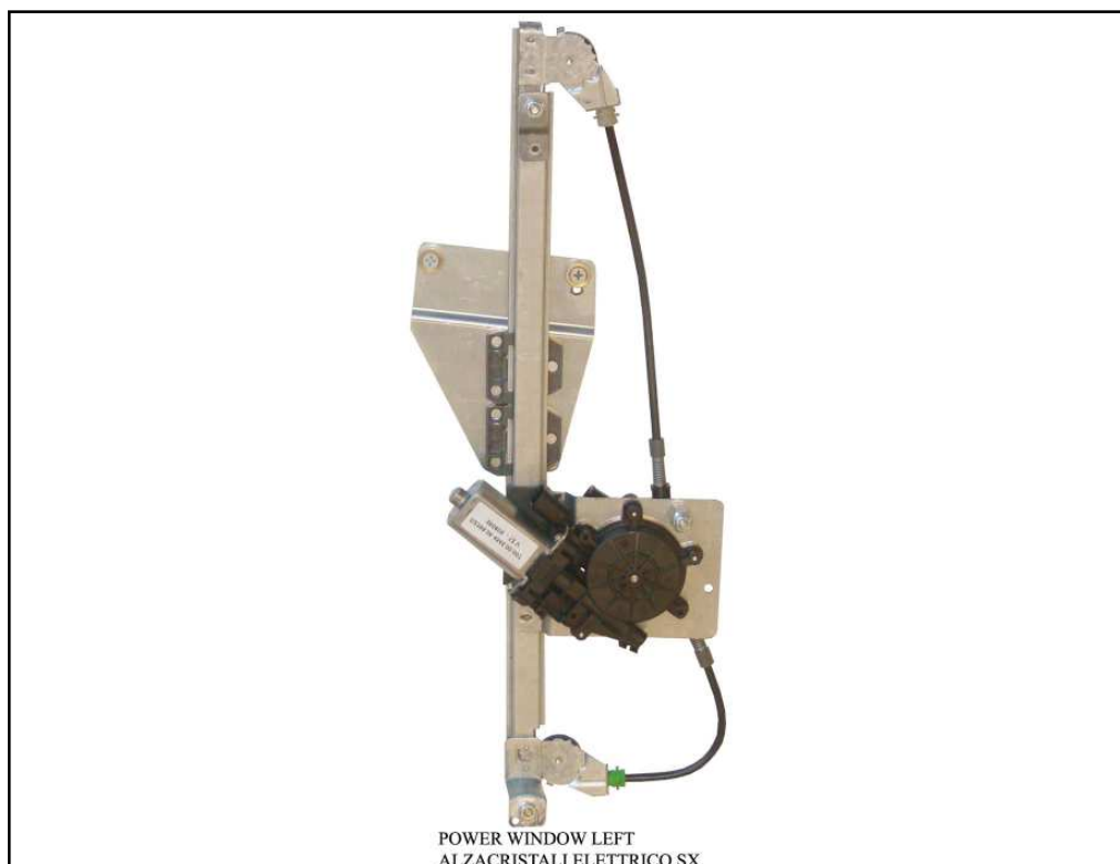
POWER WINDOW LEFT ALZACRISTALI ELETTRICO SX

LA PRESENTE ISTRUZIONE VALE SIA PER IL LATO SINISTRO CHE PER IL LATO DESTRO.