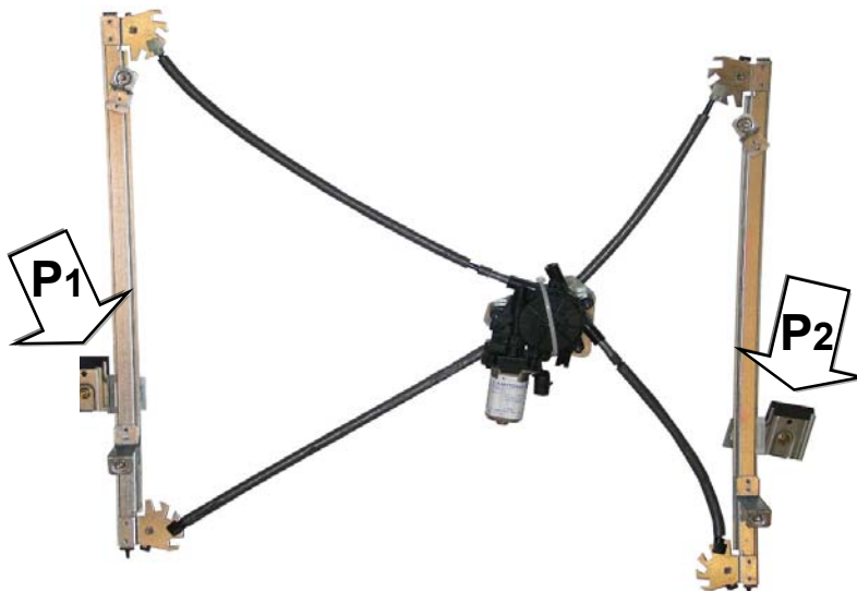
Ns alzacristallo SX