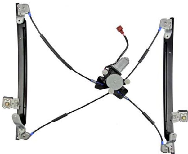
Alzacristallo originale SX