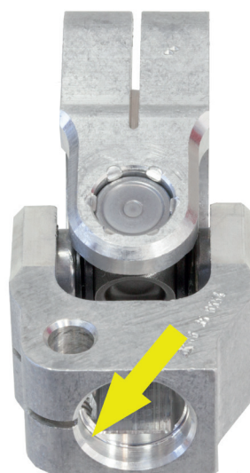
Junta universal nueva con hueco