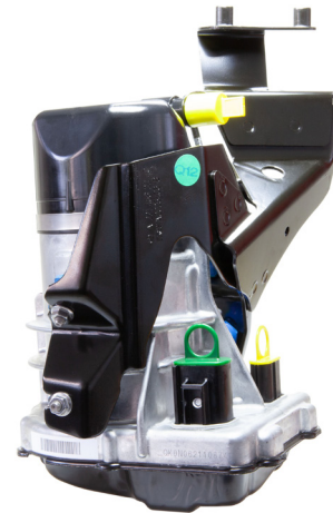
Abb. 1: JER185

Sollten die Anschlussstecker, der im Fahrzeug verbauten Lenkhilfpumpe das alte Design (vgl. Abb. 2 ) haben so ist der alte Leitungssatz durch einen neuen (vgl. Abb. 3 ) zu ersetzen. Die entsprechenden Ersatzteilnummern entnehmen Sie der unten aufgeführten Tabelle.