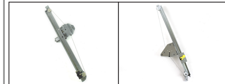
Alzacristallo originale - oem window regulator - lève-vitre original - Fensterheber von oem - elevallunas original - levantador de vidro original - orijinal cam acacagi - Γρύλος γνήσιος Nostro alzacristallo - our window regulator - notre lève-vitre - unser Fensterheber - nuestro elevallunas - nosso levantador de vidro - bizim cam acacagi - Γρύλος γνήσιος