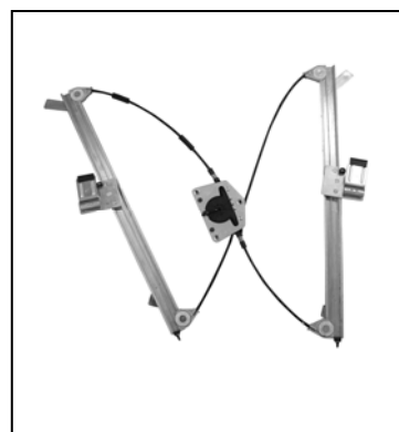
Nostro alzacristallo – our window regulator – notre lève-vitre – unser Fensterheber – nuestro elevalunas – nosso levantador de vidro - bizim cam acacagi - Γρύλος δικός μας