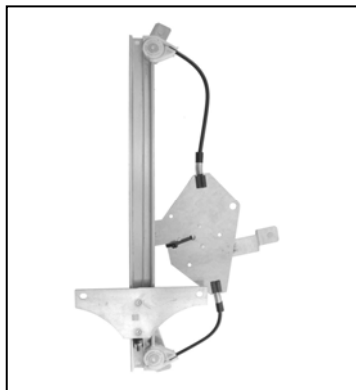
Nostro alzacristallo – our window regulator – notre lève-vitre – unser Fensterheber – nuestro elevalunas – nosso levantador de vidro - bizim cam acacagi - Γρύλος δικός μας