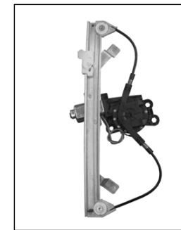
Il nostro alzacristallo – our window regulator – notre lève-vitre – unser Fensterheber – nuestro elevallas – nosso levantador de vidro – bizim cam acacagi - Γρύλος δικός μας

Alzacristallo Elettrico Electric window regulator Lève-vitre électrique Elektrische Fensterheber Elevallas eléctrico Levántador de vidrio eléctrico Elektrikli pecere düzeneği ιάταξη ανύψωσης ηλεκτρικών παραθύρων