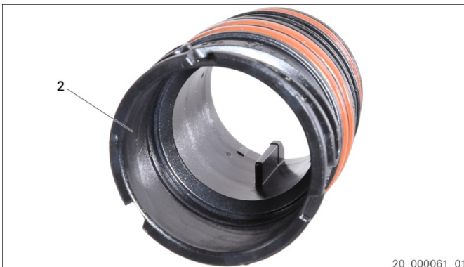
Abb. 3: Führungshülse