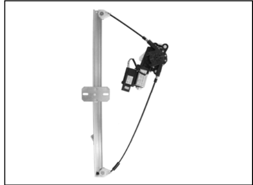
Nuestro elevavinas – notre lève-vitre – our window regulator – nosso levantador de