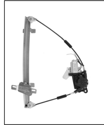
Nuestro elevavinas – notre lève-vitre – our window regulator – nosso levantador de vidro

Obrigado por ter escolhido os nossos produtos.