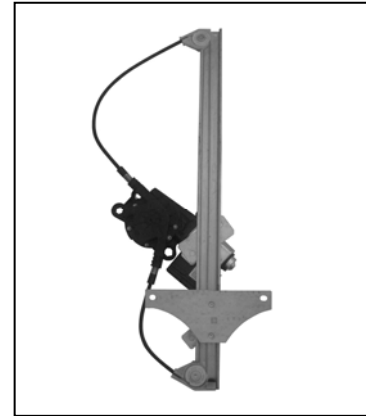
Nuestro elevavinas – notre lève-vitre our window regulator – nuestro elevavinas – nosso levantador de vidro